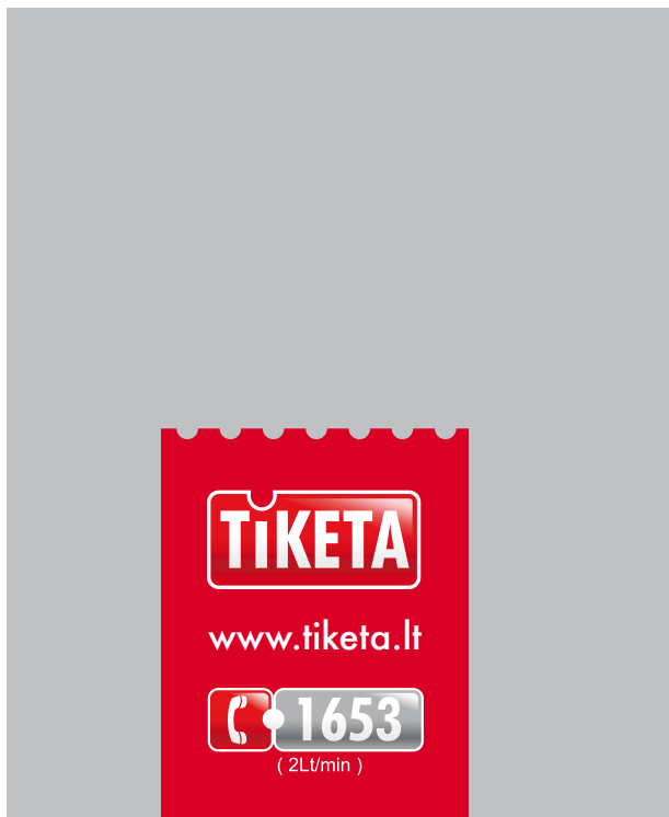
Vertikali juosta kompozicijos apačioje