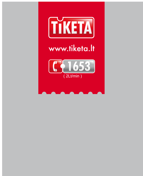
Vertikali juosta kompozicijos viršuje